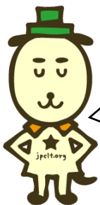
りんしょう犬さん

日時：8月18日（日）13時-17時半 懇親会あり（自由参加） 場所：東京大学医学部附属病院（東京都文京区本郷） 対象：医学部5,6年生・初期研修医（定員12名）